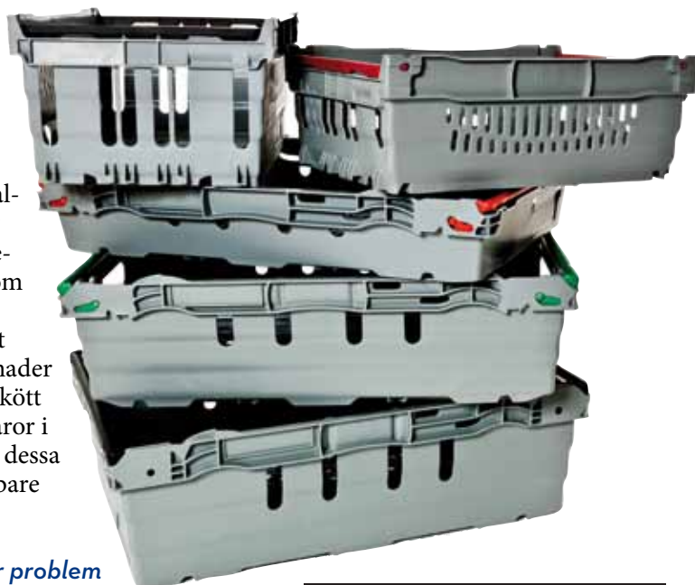
SVENSKA RETURSYSTEMS BACKAR