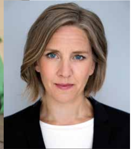
KAROLINA SKOG (MP) MILJÖMINISTER

Regeringen vill kommunalisera insamlingsansvaret för förpackningsavfall, något som branschen reagerar negativt på.